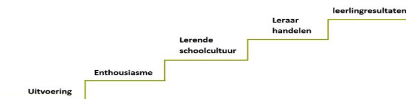
Figuur 1. De samenhangende niveaus van de effecttrap, ter illustratie en als controlemechanisme

Het huidig onderzoek is gebaseerd op de effecttrap waarin uitgegaan wordt van het meten van effecten op verschillende niveaus: van uitvoering -> enthousiasme -> lerende schoolcultuur -> leraar handelen -> leerlingresultaten (zie Figuur 1; De Jong, e.a., 2021; Guskey, 2002; Kirkpatrick, 1994).