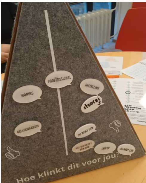
Figuur 2 Teamvoortaal demonstratie

Teamvoortaal (zie foto) probeert uitwisseling over de (emotionele) betekenis van taal en woorden te