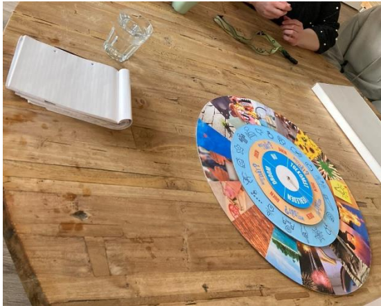
Figuur 3 Wistjedat?! demonstratie

Wistjedat?! stimuleert open contact van mens tot mens, waarbij je door middel van beelden iets over jezelf vertelt. Niet alleen de persoon die ondersteuning krijgt vertelt, maar ook de naaste en begeleider. Wistjedat?! werd gespeeld door een begeleider-deelnemer samen met een bezoeker en een vrijwilliger om elkaar te leren kennen. Het hielp het gesprek op gang te brengen. Op een woonlocatie demonstreerde een ervaringsdeskundige deelnemer, samen met een naaste-deelnemer Wistjedat?! aan begeleiders en bewoners. Een begeleider-deelnemer observeerde. "Iedere locatie moet deze tool hebben! Je leert elkaar echt anders kennen." was de conclusie van de aanwezigen